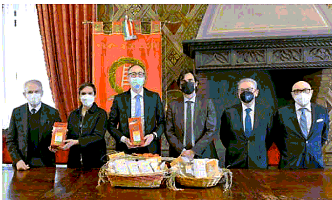
La presentazione della storica Fiera del Riso in Provincia a Verona con al centro l'assessore regionale Caner

Inoltre, Ente Fiera, società del Comune di Isola della Scala che si occupa dell'organizzazione dell'evento, grazie alla partnership stretta nel 2021 con il Tocati, curerà nell'edizione di quest'anno del Festival Internazionale dei Giochi in Strada "La cucina del festival" allestita in lungadige San Giorgio.